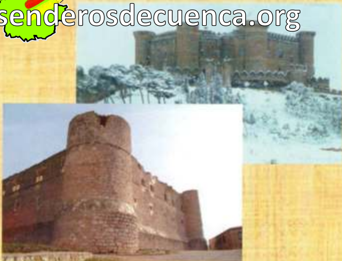
Castillos de Belmonte (arriba) y de Garcimuñoz (abajo)