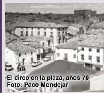
El circo en la plaza, años 70

En la actualidad, la economía se abre a un campo nuevo: el turismo, que llega para disfrutar de los bellos edificios y parajes que ofrece todo el municipio.