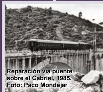
Reparación vía puente sobre el Cabriel, 1985.