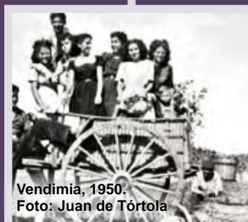
Vendimia, 1950.