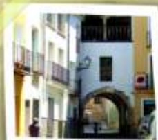
Puerta de Molino

Desde sus alrededores puede contemplarse el emplazamiento defensivo de una población que estuvo protegida por una muralla flanqueada por varias torres defensivas de las que aún se conservan algunos restos. En la distancia se recorta la torre del s. XVI.