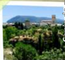
Vista de Priego

Al llegar al paraje de El Molino , llegamos junto al cauce del río Escabas que seguimos aguas arriba, alternando tramos de senda y pista. Se regresa al pueblo tras cruzar de nuevo el puente medieval.