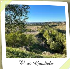
El río Guadiela

Desde Castejón, el trazado baja, entre antiguas cuevas de vino, a los campos de cultivo que se extienden hacia el norte. Tras cruzar la CUV-2131 el trazado pasa por el yacimiento visigodo del Romeroso. Después se cruza la carretera CUV-2132 y, por el interior de un pinar, alcanza las aguas del río Guadiela, por una zona inundable del embalse de Buendía.