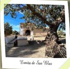
Ermita de San Blas

Cuando recorremos los caminos, no siempre somos conscientes de que pasamos a formar parte de su historia, como antes lo hicieron nuestros ancestros. El sendero invita a hacer un recorrido entre el presente y el pasado a través de la epopeya vivida en algunos lugares construidos a tenor de la tradición eremítica en época del reino visigodo datados en el s. VI, por monjes relacionados con el monasterio Servitano, construido en las cercanías de Ercávica.