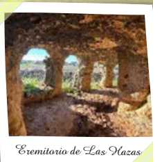
Ermita de San Blas

El regreso a la población se realiza primero por una senda y después por pistas, pasando por la ermita de San Blas, patrón de la localidad. Desde la ermita, el trazado sube a Castejón, con amplias vistas del sendero y de La Alcarria.