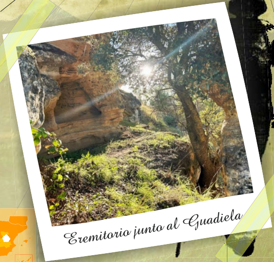
Eremitorio junto al Guadiela